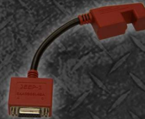
EAA0355L49A ADAPTADOR JEEP-1