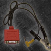
EAA0355L75A ADAPTADOR MERCEDES BENZ MB-2A