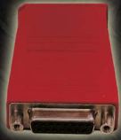
EAA0355L58A ADAPTADOR NISSAN-2