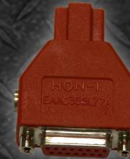
EAA0355L77A ADAPTADOR HONDA 3 PIN