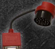
EAA0355L74A ADAPTADOR BM-1B - BMW