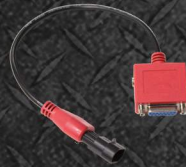
EAX0066L85A ADAPTADOR VW-2 (3 PIN)