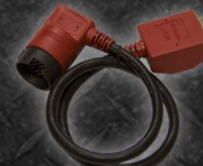
EAA0355L62A ADAPTADOR MB-1 MERCEDES BENZ